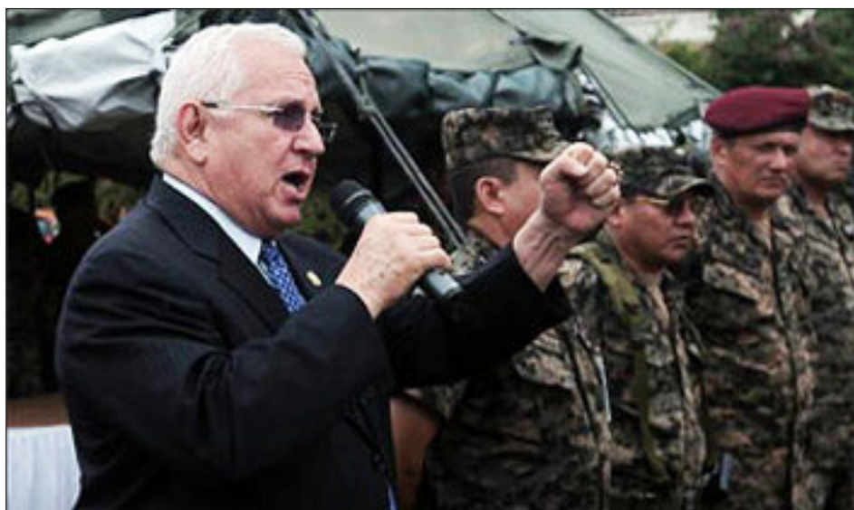
Micheletti dankt militairen voor hun hulp bij de staatsgreep

De afkondiging van de noodtoestand is algemeen bekritiseerd, zelfs in kringen die achter de staatsgreep staan. De voorzitter van het Congres, Jose Angel Saavedra, heeft in een onderhoud met Micheletti, waar vertegenwoordigers van verschillende politieke partijen aanwezig waren, gevraagd om de noodtoestand op te heffen. De Nationalistische Partij heeft openlijk gezegd bij de behandeling in het parlement tegen te zullen stemmen. [17]