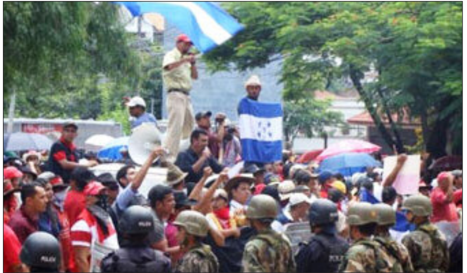
Ondanks repressie blijft de bevolking in verzet

ziliaanse regering 10 dagen de tijd gegeven om duidelijkheid te geven over de status van Zelaya, anders wordt de diplomatieke status van de ambassade opgeheven. [2]