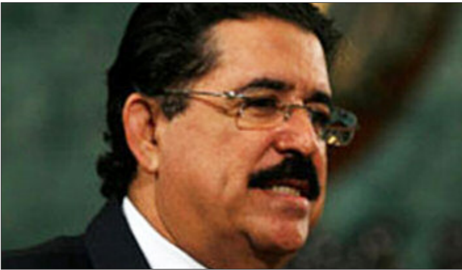
Manuel Zelaya

was gevormd om landbouwhervormingen door te voeren. De boeren hadden het instituut meteen na de staatsgreep bezet om het archief van 40 jaar strijd voor recht op land, dat voor het eerst onder president Zelaya steun had gekregen, te beschermen. [4]