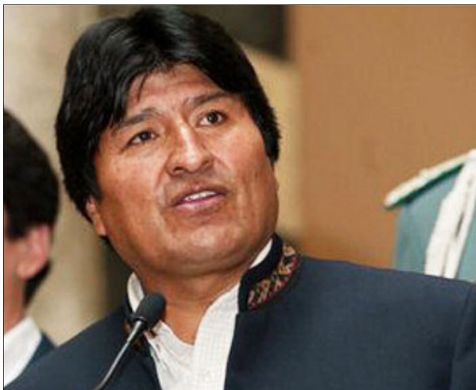
Evo Morales

Volgens de Guatemalteekse Nobelprijswinnares Rigoberta Menchú heeft het de crisis in Honduras effect op geheel Midden-Amerika en genereert het in Guatemala fascistische