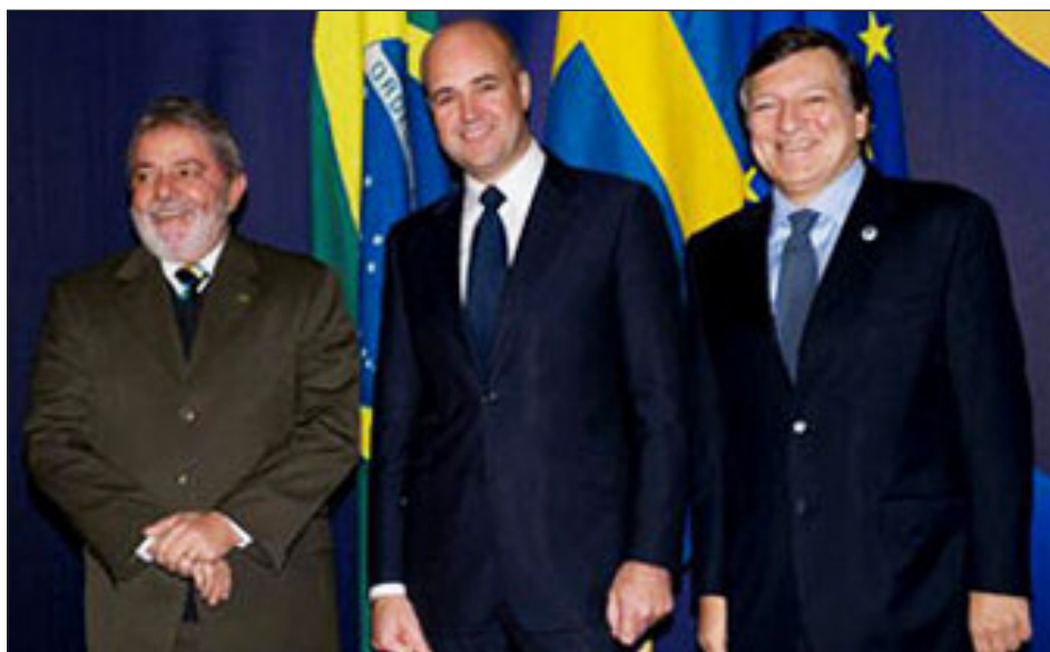
Vlnr president Lula, premier Reinfeldt en EU-commissievoorzitter Barroso

De delegatie heeft ook met andere sectoren, zoals het Hooggerechts-hof, presidentskandidaten en verte-