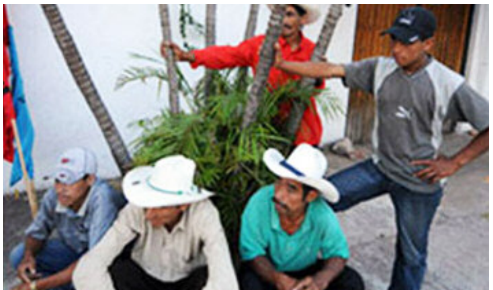
Boeren op de binnenplaats van de ambassade van Guatemala

Het Nationaal Front tegen de Staatsgreep heeft zondag regionale vergaderingen belegd om hun strategie te bepalen, gezien de toeneemende repressie. De afgelopen week zijn demonstraties door leger en politie verhinderd. Ondanks de